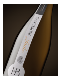
Sancerre blanc « Jadis » Kimméridgien p. 15-16