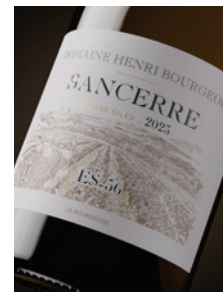
Sancerre blanc « ES-56 »* Silex p. 11-14