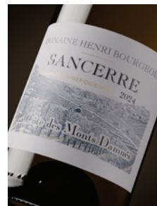
Sancerre blanc « La Côte des Monts Damnés » Kimméridgien p. 11-14