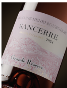
Sancerre rosé « Grande Réserve » Calcaire p. 11-14