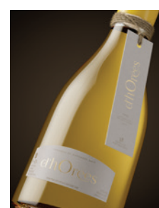
Récoltée tardivement « d'hOrées » Kimméridgien p. 20