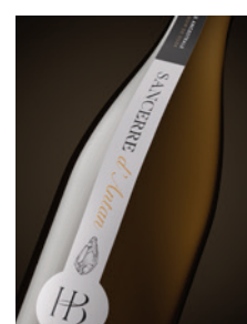
Sancerre blanc « d'Antan » Silex p. 15-16