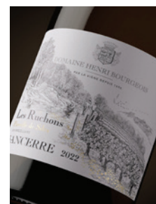
Sancerre blanc « Les Ruchons » Silex · Parcelle p. 17