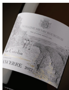
Sancerre blanc « Le Cotelin » Kimméridgien · Parcelle p. 17