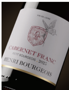
IGP Val de Loire « Petit Bourgeois » Cabernet franc p. 7-8