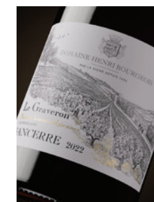
Sancerre rouge « Le Graveron » Kimméridgien · Parcelle p. 17