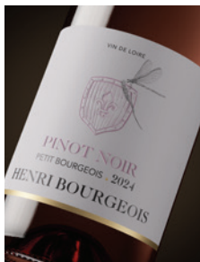
IGP Val de Loire « Petit Bourgeois » Rosé de Pinot noir p. 7-8