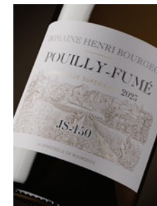
Pouilly-Fumé « JS-150 »** Kimméridgien p. 11-14