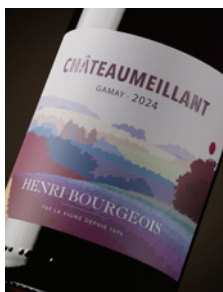
Châteaumeillant Gamay p. 9-10