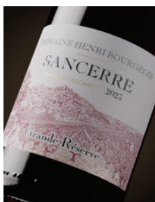
Sancerre rouge « Grande Réserve » Calcaire p. 11-14