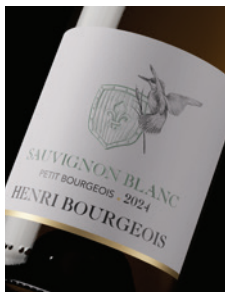
Vin de France « Petit Bourgeois » Sauvignon blanc p. 7-8