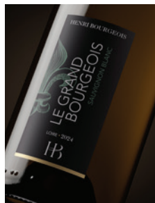
IGP Val de Loire « Le Grand Bourgeois » Sauvignon blanc p. 7-8