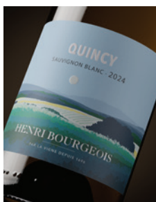
Quincy Sauvignon blanc p. 9-10