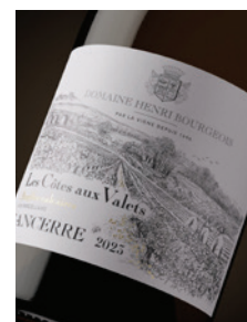
Sancerre blanc « Les Côtes aux Valets » Calcaire · Parcelle p. 17