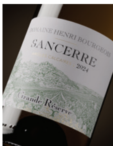
Sancerre blanc « Grande Réserve » Calcaire p. 11-14