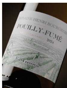
Pouilly-Fumé « En Travertin » Calcaire p. 11-14