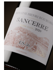
Sancerre rouge « ES-56 »* Silex p. 11-14