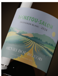
Menetou-Salon Sauvignon blanc p. 9-10